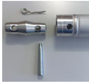
Encarar 2 Tramos a unir

3.2.- Una vez llevada a cabo la unión pasar los pasadores y las palometas, asegurando la correcta unión entre las cuatro uniones de cada tramo.