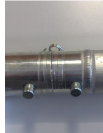
Unir los Tramos y asegurar los pasadores.

3.3.- Cuando se cargue el tramo puntualmente se recomienda el uso de cintas o eslingas con resistencia suficiente y que abracen los cuatro perfiles principales tal y como se muestra en la siguiente imagen.